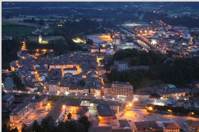
Comuni di Castellino Tanaro, Ceva, Ciglié, Lisio, Montezemolo, Priero, Rocca Ciglié, Sale San Giovanni, Scagnello